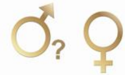
Abbildung 1: Geschlechterunterschiede bei PSI4 werden im höheren Alter signifikant. (nach Gleissner , 2014)

Abbildung 1 zeigt den hochsignifikanten Unterschied zwischen Männern und Frauen hinsichtlich einer schweren Form der Parodontitis (PSI4). Männer weisen besonders im höheren Lebensalter (65-74) deutlich häufiger eine schwere Form der Parodontitis auf als Frauen.