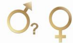
Abbildung 2. Geschlechterunterschiede bei Rauchern und Nichtrauchern