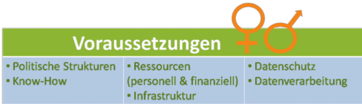
Grafik 2. Voraussetzungen individualisierter Medizin. Modifiziert nach: Harreiter et al. (2016).]]

Ziel ist nicht nur die Verbesserung von Behandlungsstrategien, sondern auch Krankheiten bereits präventiv abwenden und Lebensqualität aufrechterhalten zu können. Für eine adäquate Umsetzung individualisierter Betreuung sind nicht nur bestimmte politische und gesetzliche Strukturen notwendig, sondern auch Aspekte wie infrastrukturelle Gegebenheiten und ausreichend finanzielle sowie personelle Ressourcen erforderlich. Um alle medizinischen Informationen verwalten und steuern zu können, muss zudem ein gewisser Standard bezüglich Datenschutz und -verarbeitung gewährleistet werden (vergleiche Grafik 2).